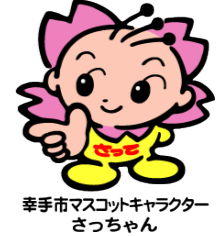
幸手市マスコットキャラクター さっちゃん