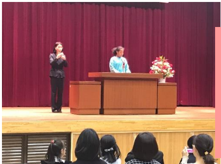
12/8 幸手市人権 作文発表会 立派な発表 でした。