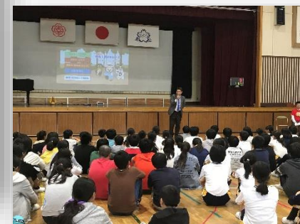
11/19 心肺蘇生法講習会 幸手中央ロータリークラブの皆さんのご支援により、6年生がいざというときの救命方法を学びました。